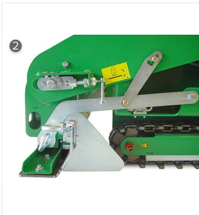
Plancha con calentado eléctrico, mecanismo de ajuste para inclinación, limitador de material