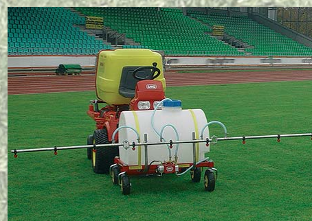
Dosificadora de líquidos Dosificadora de líquidos