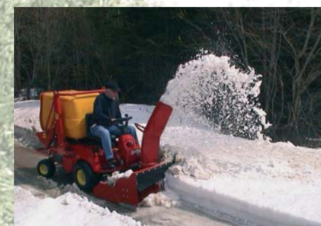
Fresadora de nieve Fresadora de neve