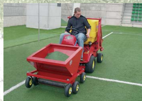
Recebadora Máquina de reposição