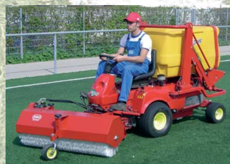
Barredora superficial Varredora superficial