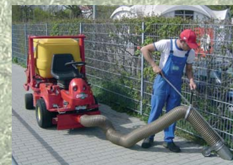
Tubo de aspiración Tubo de aspiração