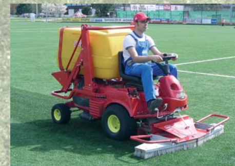
Cepillo de peinado Escova de endireitamento