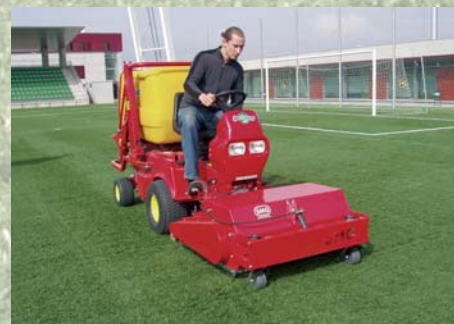
Cepillo rotativo y de limpieza Escova de limpeza rotativa