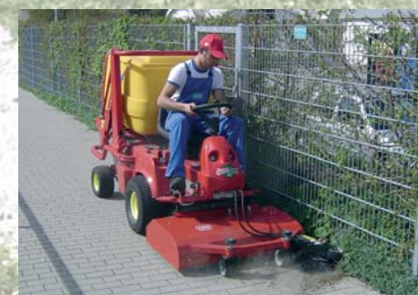
Cepillo doble Escova dupla