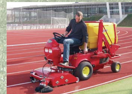
Cepillo doble de rotación inversa Escova dupla contra-rotativa