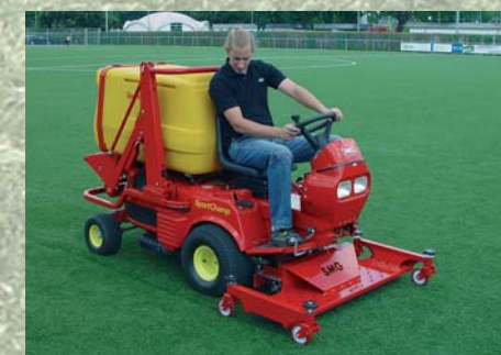
Unidad de descompactación Unidade de descompactação