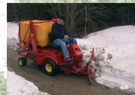
Pala de nieve Limpa-neve

Sport Care, S.L. Calle Marathón, 6 - Loft 11 28037 Madrid (Spain) Telefon +34 913121000 - 626978430 Telefax +34 913049851 info@sport-care.com