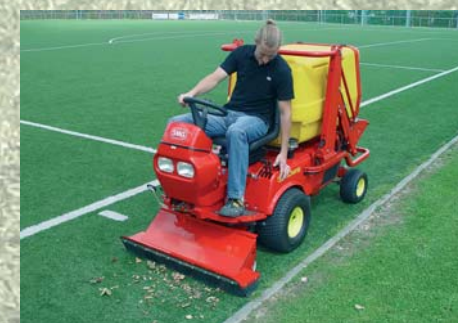
Aspirador de hojas Aspiradora de folhas