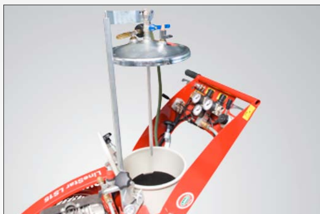
Depósito de pintura de 16 litros, intercambiable