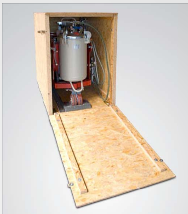
Cajón de transporte con fijaciones