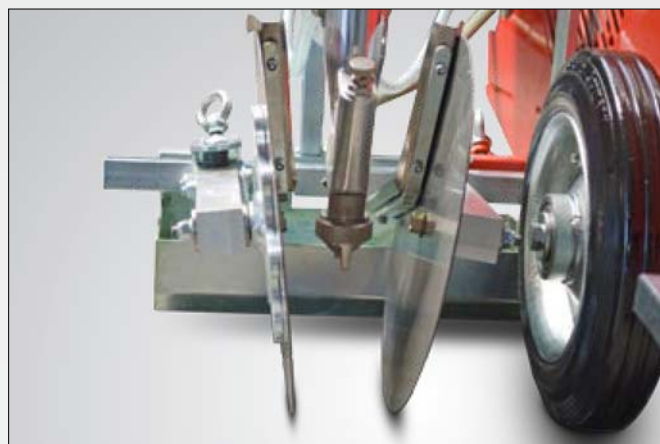
Unidad de línea, con discos delimitadores, ancho de línea variable