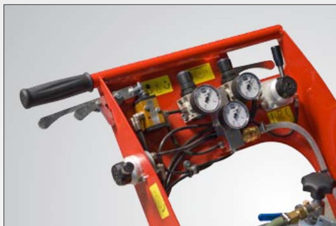
Control neumático de todas las funciones, dispuesto de forma clara