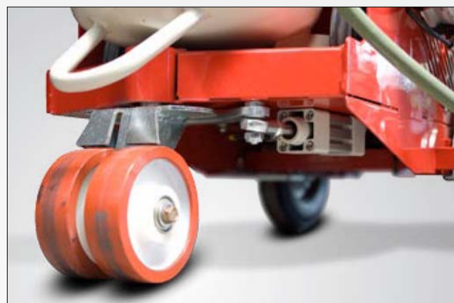
Rueda neumática con fijación, como apoyo de la dirección